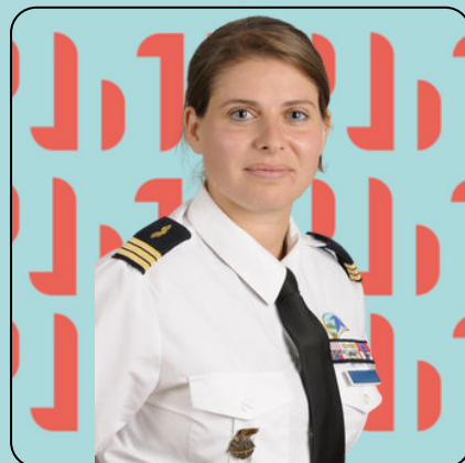
COMMANDANT MARION ESCADRILLE DE FORMATION AU COMMANDEMENT N°3 À L'ÉCOLE DE L'AIR ET DE L'ESPACE SALON